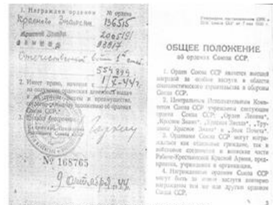
ОДЕНСКАЯ КНИЖКА ФЕДОРОВА И.М.