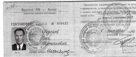
УДОСТОВЕРЕНИЕ №899437 УЧАСТНИКА ВОЙНЫ ФЕДОРОВА И.М.